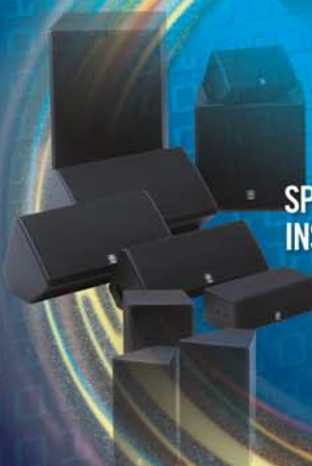
SPEAKER DA INSTALLAZIONE