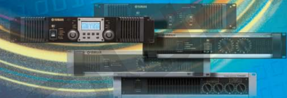
FINALI DI POTENZA

Yamaha Ti offre una soluzione per tutte le esigenze, supportando le più innovative tecnologie di network digitale.