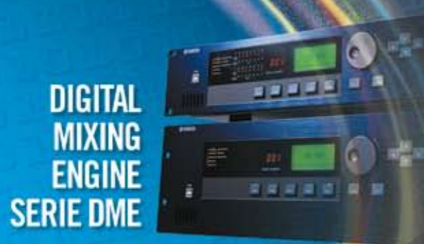
DIGITAL MIXING ENGINE SERIE DME