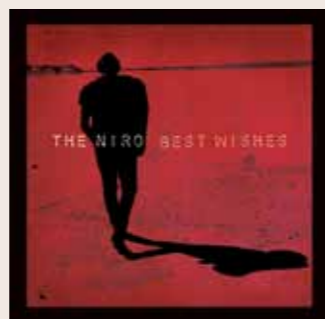
The Niro: Best Wishes (2010). Che bello, un disco personale nel mercato globale.

Il pubblico è intelligente, furbo, sagace, sapiente e meno complicato di tutti i discorsi possibili. Il pubblico è la somma di me e te. Il pubblico vuole trovare solo quel granello di verità che nell'universo forse rappresenta poco, ma che nella galassia della propria au-