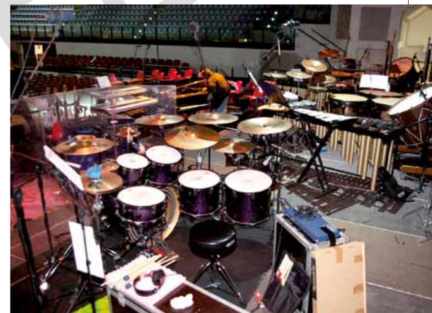
La sezione delle percussioni sul palco.