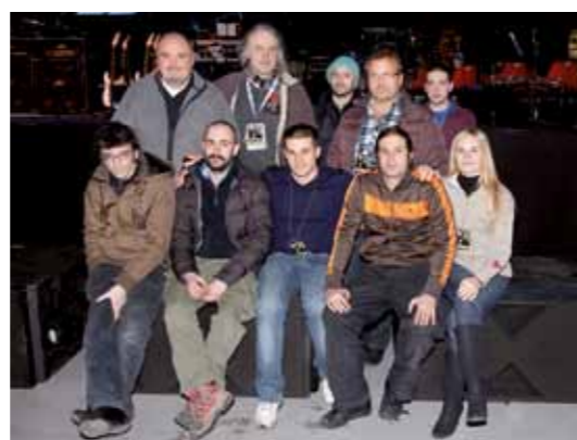
Lo staff tecnico.

"Abbiamo montato un PA formato da due cluster di 12 casse per parte – ci dice Giorgio – dieci J8 e due J12. Personalmente avrei preferito usare anche un centrale, mentre alla fine la scelta è caduta su dei diffusori front fill appog-