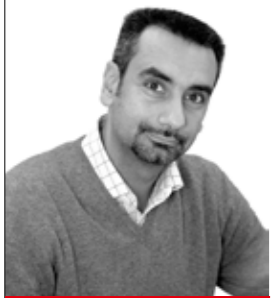
di Giancarlo Messina